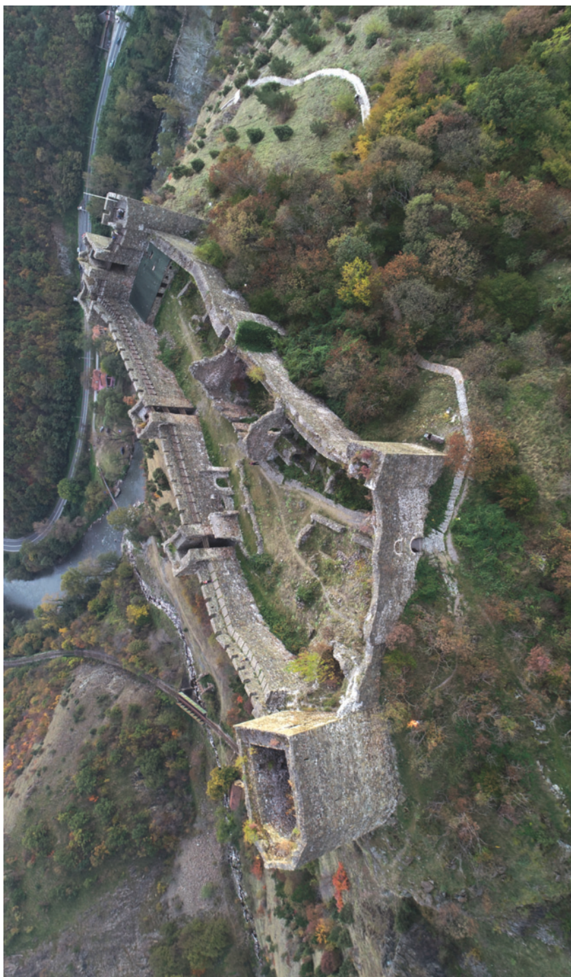
7. Маглич, средњовековно утврђење