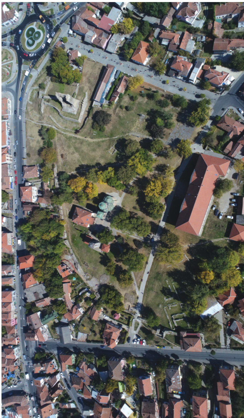
1. Крушевац, средњовековно утврђење