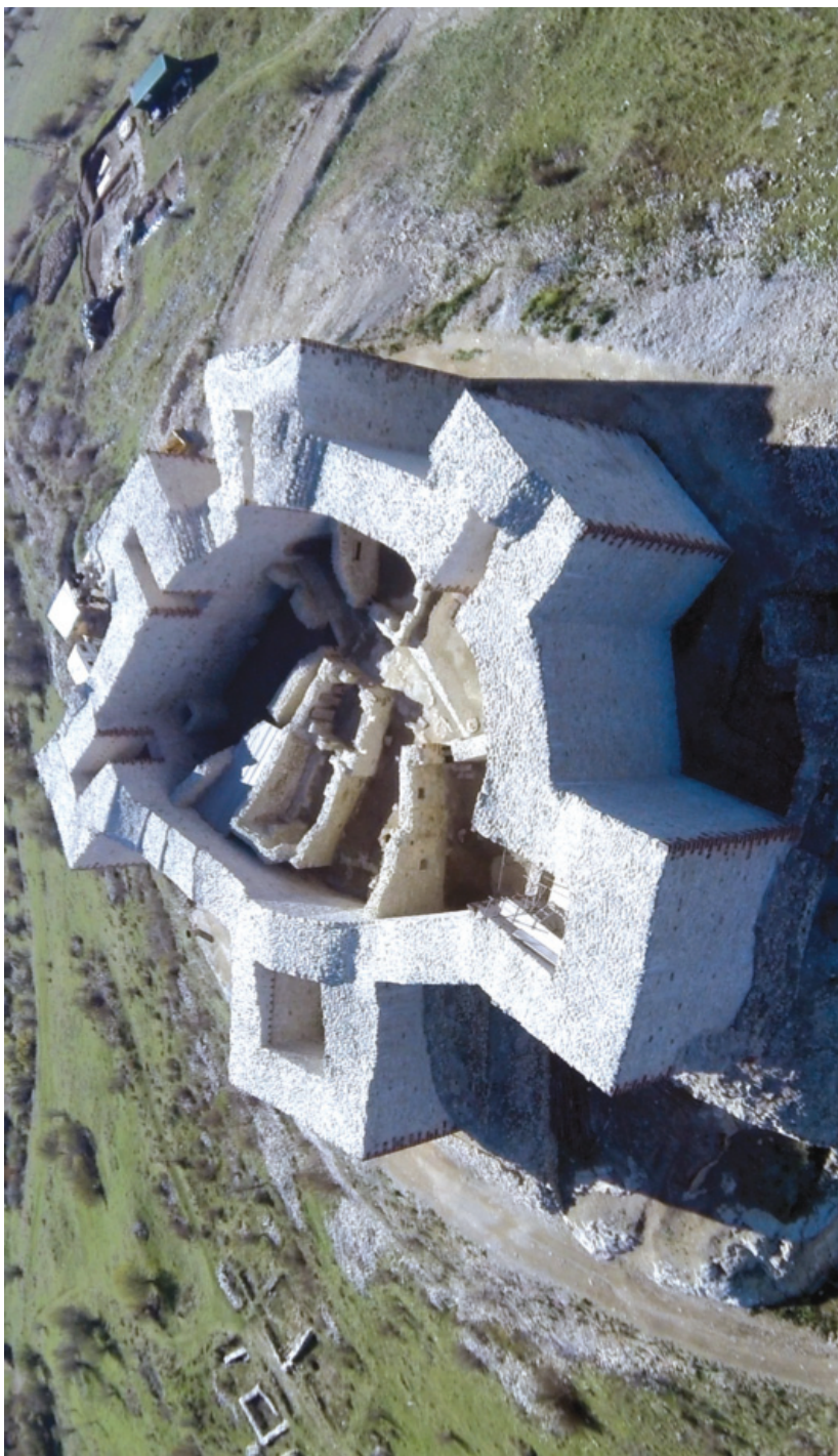
3. Ново Брдо, цитадела