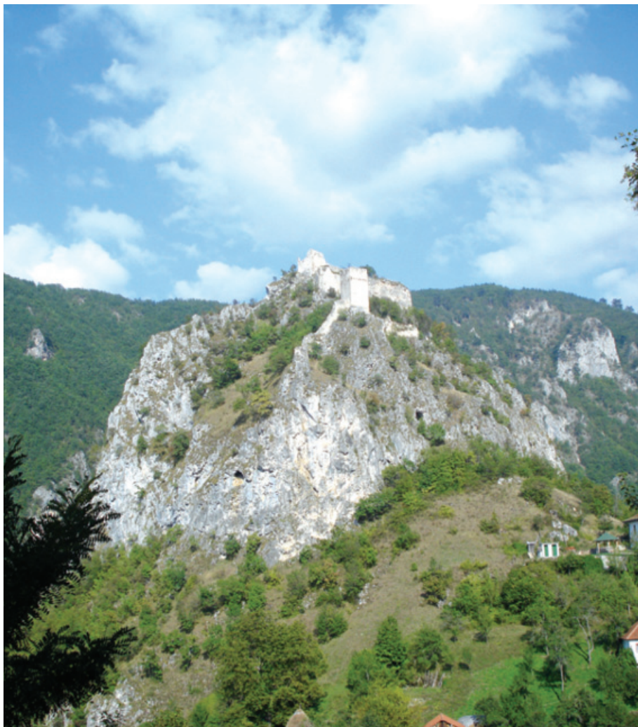
5. Милешевац, средњовековно утврђење