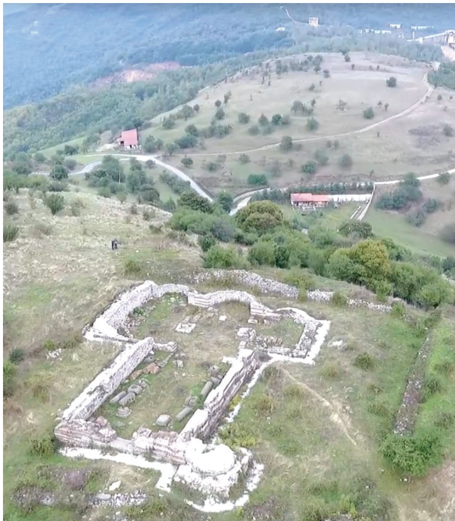
4. Ново Брдо, Црква Светог Николе, катедрала