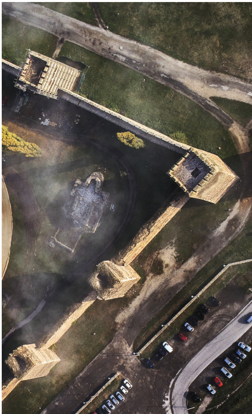
2. Смедеревски град, средњовековно утврђење