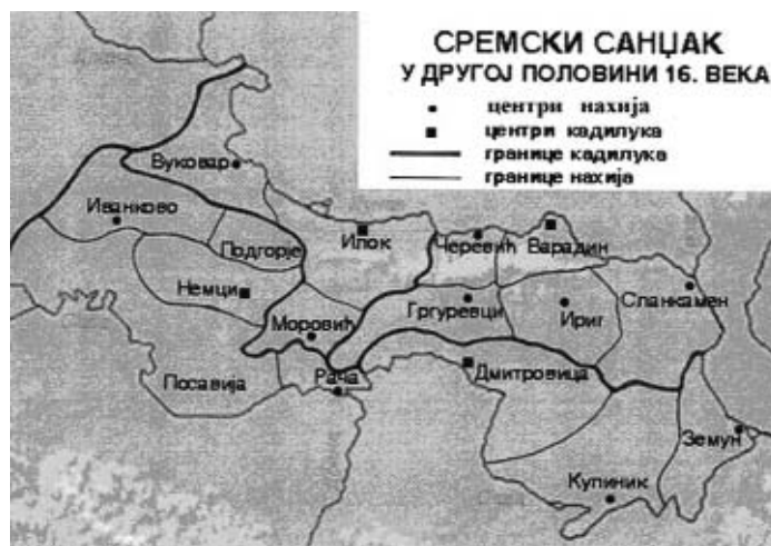
Карта преузета из В. W. McGowan, Sirem Sancađi mufassal tahrir defteri , карта бр. 1.

Сремски санџак је у време оснивања, 1543. године, имао 24 нахије, од којих је једну чинио Земун са околином. За време владавине Селима II (1566-74) број нахија се смањио на 16. Највећа је била илочка, а најмања нахија Рача. У односу на остале, земунска нахија је спадала у мање. Око 1578/9. године број нахија је остао исти. 47 Земун је био седиште истоимене нахије, а у XVII веку је постао и седиште кадилука. 48 Пре тога је, (1578/9.) малобројно муслиманско становништво земунске нахије било под јурисдикцијом београдског кадије. 49