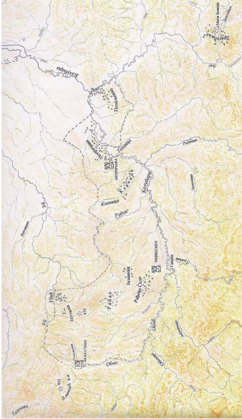
Посед српског властелина Детоша у XIV веку