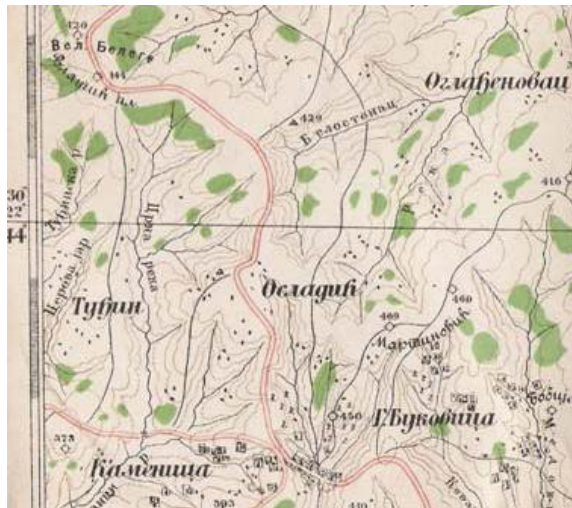
Сл.2 - Поток Белостенац, (Карта Српског Ђенералштаба 1898. године, размера 1:75 000 В.3. Каменица)

У непосредној близини изворишта реке Уб на највишем делу планине Влашић извире поток Белостенац. Четири изворишна крака Белостенца теку са Божића брда (438 m) и брда Грабовац (432 m), између села Осладић и Оглађеновац, непосредно поред пута преко Влашић планине. 9 Погодно место за подизање једног средњовековног утврђеног града било би на ушћу потока Белостенца у Оглађеновачку реку, или