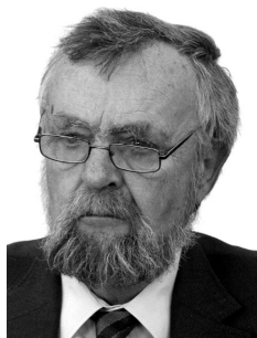
Војин С. Дабић (1949–2017)