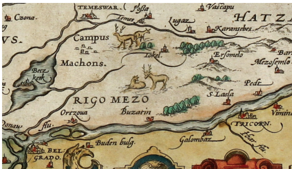
Сл. 6 Ungariae Loca Praecipua Recens Emendata atque Edita , per Ioannem Sambucum Pannonium, 1579.