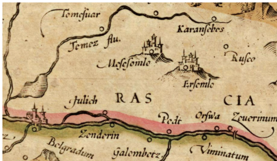
Сл. 7 G. Mercator, Walachia, Servia, Bulgaria, Romania , Amsterdam 1589.