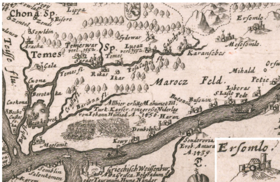
Сл. 5 J. Sandrart, Neue Land-Tafel von Hungarn und dessen incorporirten Königreichen und Provinzen , Nürnberg 1664.