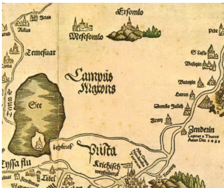
Сл. 2 Lazarus Secretarius, Tabula Hungarie , Ingolstadt 1528.