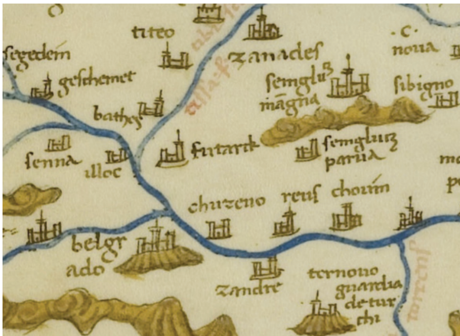
Сл. 1 Insularium illustratum Henrici Martelli Germani , Bibliothèque du château de Chantilly, Ms 698 (Ms 483), fol. 64v–65.