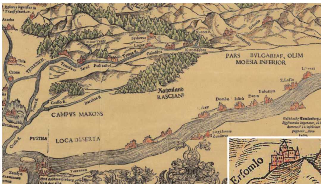
Сл. 3 W. Lazius, Karte des Konigreichs Ungarn. Regni Hungariae Descriptio Vera , Vienne 1556.