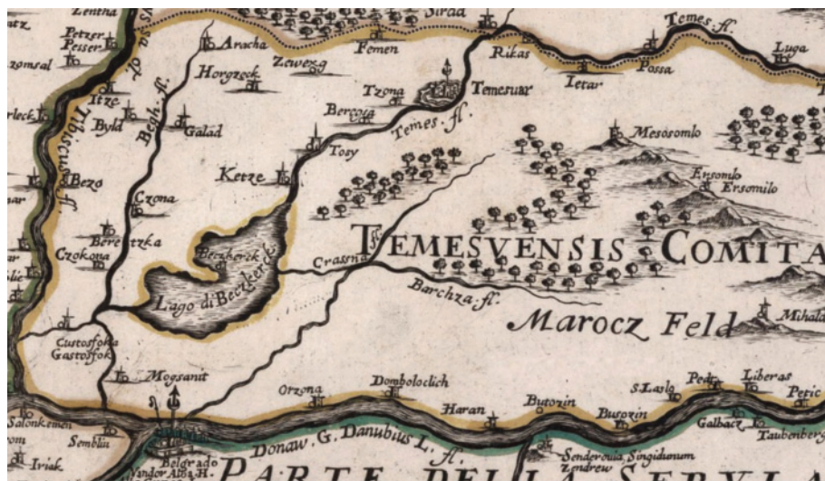
Сл. 11 G. Cantelli, G. G. Rossi, D. Rossi, Vngaria Occidentale , Roma 1689.