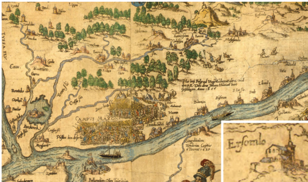
Сл. 4 M. Zundt, Nova totius Ungariae descriptio , 1567.