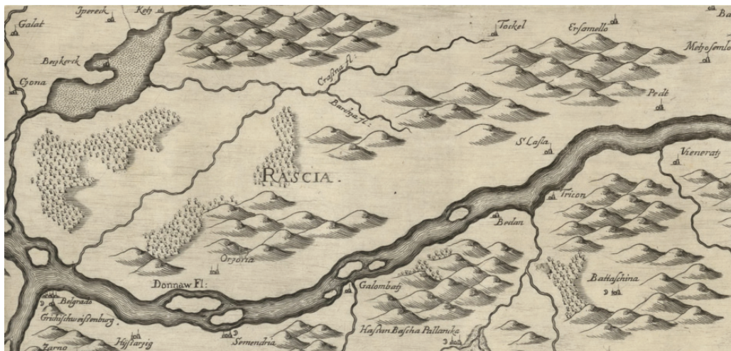
Сл. 9 М. Stier, Landkarten des Konigreichs Ungarn , Wien 1664.