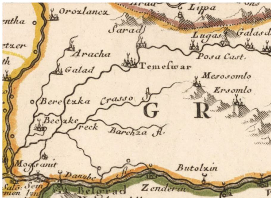
Сл. 8 N. Sanson, Hungrie, Transilvanie, Esclavonie, Croacie, Bosnie, Dalmacie , Paris 1665.