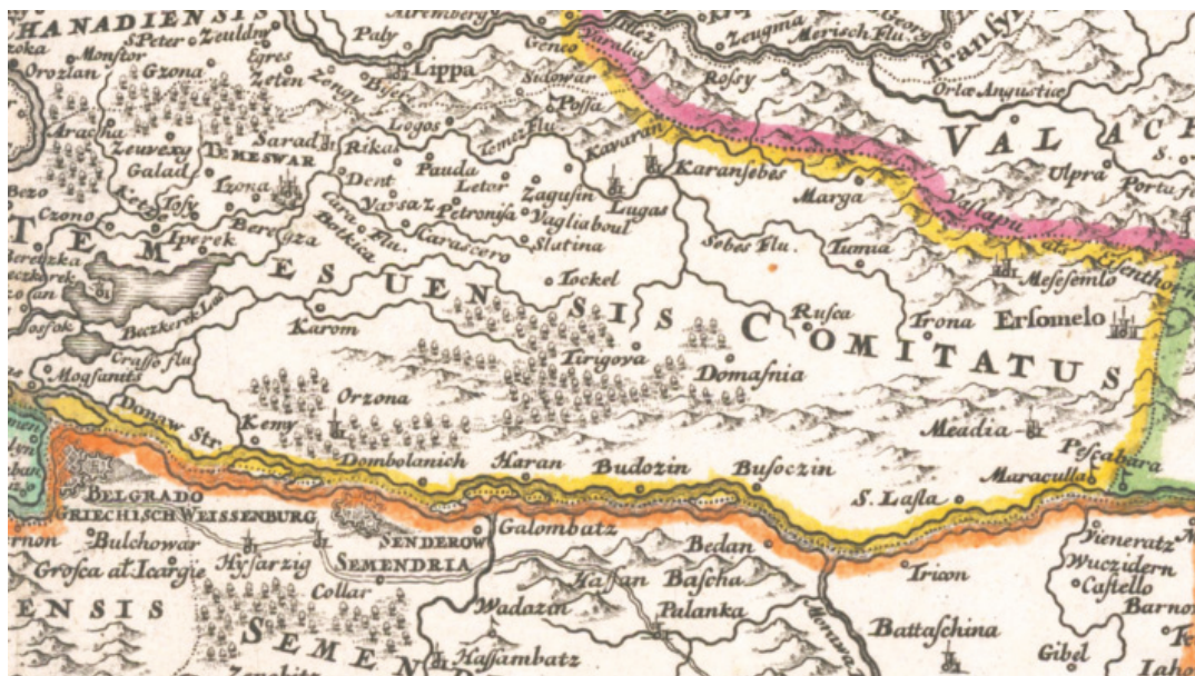
Сл. 12 J. B. Homann, Regnorum Hungariae, Dalmatiae, Croatiae, Sclavoniae, Bosniae, Serviae et Principatus Transylvaniae novissima exhibitio , Nürnberg cca 1715.