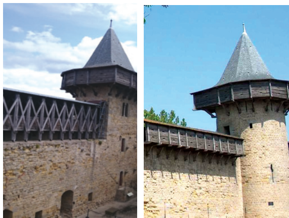
Сл. 3 и 4 – Претпостављени изглед с унутрашње и спољашње стране 8

Вишеградско утврђење коришћено је вековима, све до 1838. године када је из њега повучена посада. 9 Куле и бедеми су тада разрушени, па се сада на врху Павловине једва могу уочити остаци некадашње грађевине.