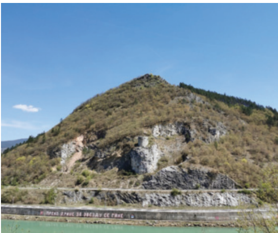
Сл. 6 – Брдо Павловина и „Маркова кула” – савремени снимак

Подаци из Стратимировићевог чланка често су навођени у историографији, али ни у једном раду није постављено питање стварне улоге „Маркове куле” и њене повезаности с дворцем, који су, како ће се испоставити, кључни за разумевање вишеградских фортификација, улоге подграђа, па и питања порекла назива Вишеград. 12