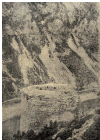
Сл. 5 – „Маркова кула” 1891.

„намјена куле била је – кано опће при сличним градовима средњега вијека – да мотри на ријеку.” 11