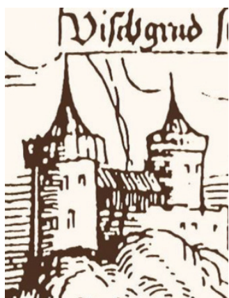
Сл. 2 – Вишеградски дворца

Наткривено круниште било је знатно више од бедема, па се на гравирани види његов горњи део с дрвеном конструкцијом. Приближан изглед куле с наткривеним круништем с унутрашње и спољашње стране дворца приказан је на сликама 3 и 4.