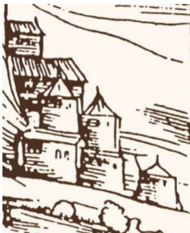
Сл. 7 – Детаљ гравире

бедем представљао је само једну утврђену страну простора који је опасивао. Бедем се од „Маркове куле” морао настављати низ Дрину, дуж Подграђа Вишеграда. Да је Подграђе било утврђено, указују и округле куле, попут „Маркове”, које су приказане на Курипешиневој гравирани (сл. 7). Временом су куле и бедеми разграђени, док је „Маркова кула” једино опстала захваљујући неприступачном положају на стени.