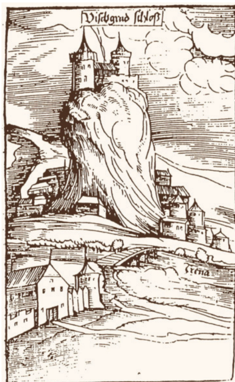
Сл. 1 – Курпешкићева гравира Вишеграда

На реци која је у првом плану написао је Дрина, па би на први поглед могло да се закључи да је приказ града начињено с леве обале Дрине. Према конфигурацији терена, положају каравансараја и дрвеном мосту с три лука, јасно је, међутим, да се ради о Рзаву. Може се претпоставити да је Курпешкић написао Дрина јер је ту ушће Рзава у Дрину, или је због упоредног тока двеју река закључио да је Рзав крак Дрине. Курпешкићева гравира, урађена више од века после изградње дворца, показује да, по свему судећи, није дограђиван после османског заузимања, већ је задржао првобитни, средњовековни изглед.